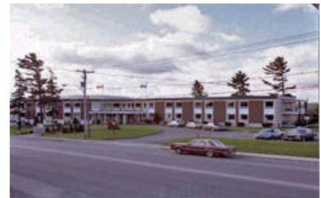
La résidence Denis-Marcotte est située au 56, 9 e Rue Sud, à Thetford-Mines

Buts du groupe d'entraide : favoriser les rencontres sociales, fournir du soutien et de l'encouragement, obtenir de l'information sur la maladie, partager des témoignages sur sa propre réalité.